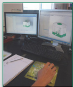
CAO / CFAO