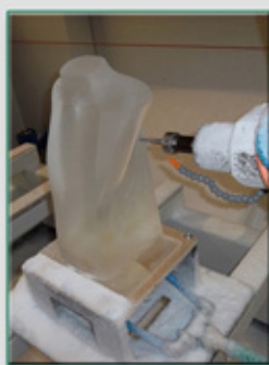
Usinage 5 axes